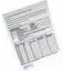
Çay Ağacı Kremi