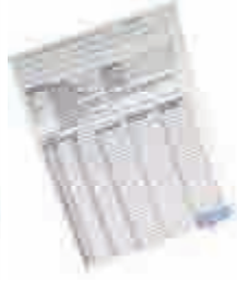
Leke Karşıtı Serum