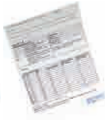
Deo Roll On