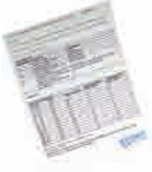
At Kestanesi Kremi