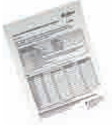
El ve Yüz Kremi