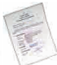
Kapıdan Satış Yetki Belgesi