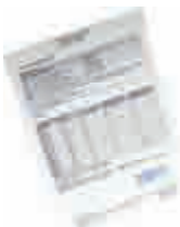
3'lü Bakım Kürü