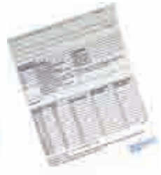
Makyaj Temizleme Suyu