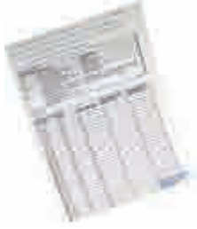
Göz Çevresi Bakım Serumu