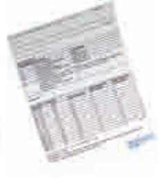
Kaş ve Kirpik Serumu