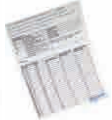
Aynı Sefa Kremi