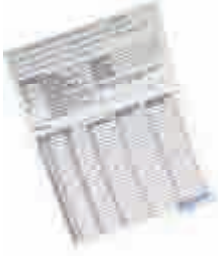
C Vitamini Serumu